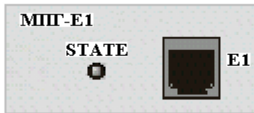
Рис.1. Вид передней панели модуля МПГ-Е1.

Внешний вид передней панели модуля приведен на рисунке 1.